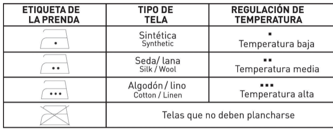
Planche la ropa de acuerdo con los símbolos internacionales de las etiquetas correspondientes o, ante la ausencia de etiquetas, según el tipo de tela.

Comience por planchar las prendas que requieran baja temperatura. Esto le permite ahorrar tiempo y elimina el riesgo de quemar la tela.